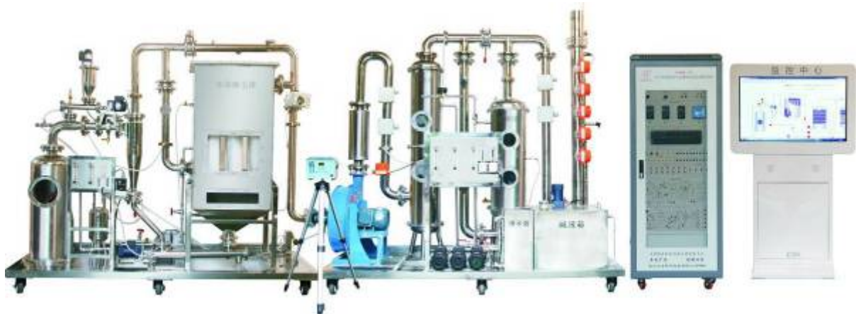
图 1 赛项平台

本赛项平台主要由烟气发生系统、烟气除尘系统、烟气脱硫系统、电气控制系统和烟气监测系统等五部分组成。赛项平台如图 1 所示。